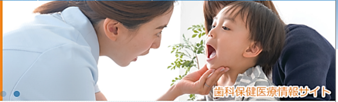
歯科保健医療情報サイト