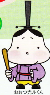
おおつ光ルくん (京都新聞共催事業)