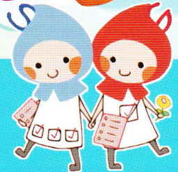
滋賀県健康づくりキャラクター「しがのハグ&クミ