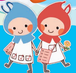
滋賀県健康づくりキャラクター しがのハグ&クミ